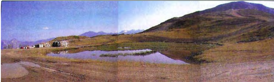
Croquis d'intégration de la digue dans le paysage et lac de la Vieille aujourd'hui