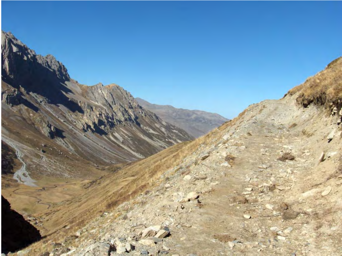
Nouvelle piste 4x4 au vallon de l'aiguille Noire