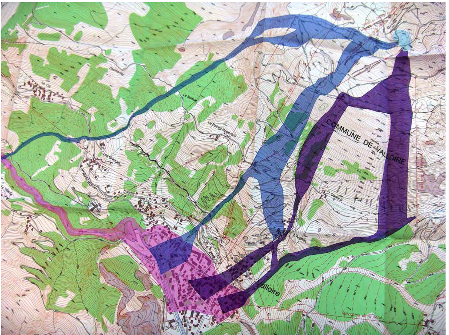
Zones potentiellement atteintes dans les différents scénario de rupture de digue