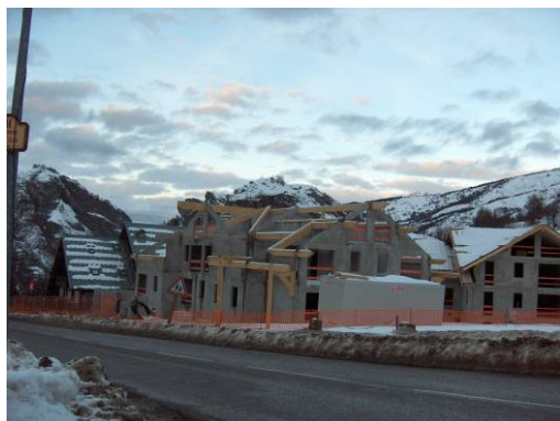
La résidence de la Grand Vy