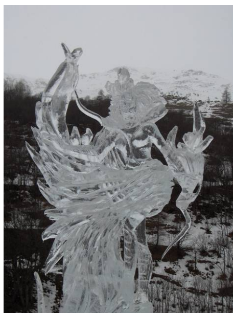
Statue de Glace : La reine du Soleil