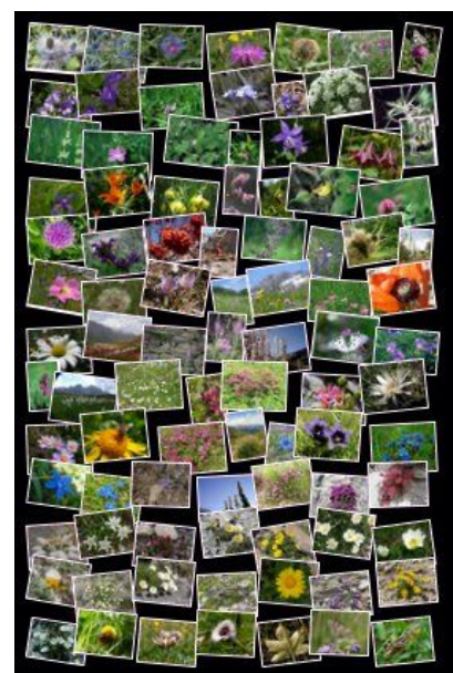
Affiche Expo Eté 2006