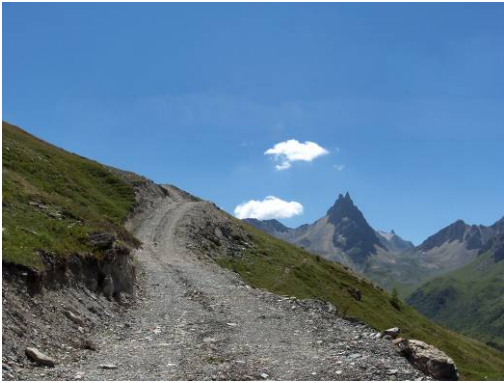
Nouvelle piste 4x4